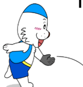
キャプテンわん © ゆず華・(公財)横浜市スポーツ協会